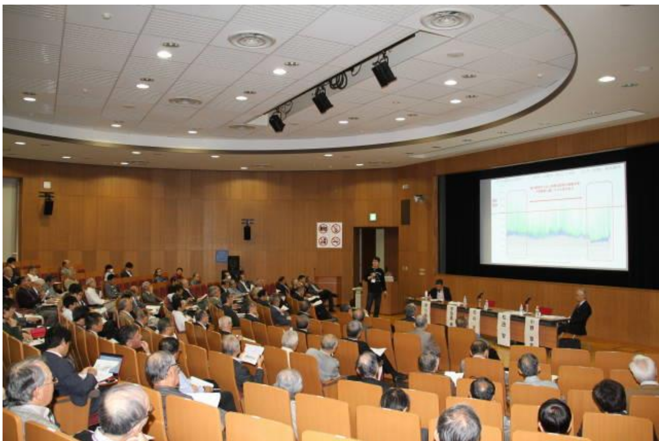
(写真 その1 会場全景 東工大・多目的デジタルホール)