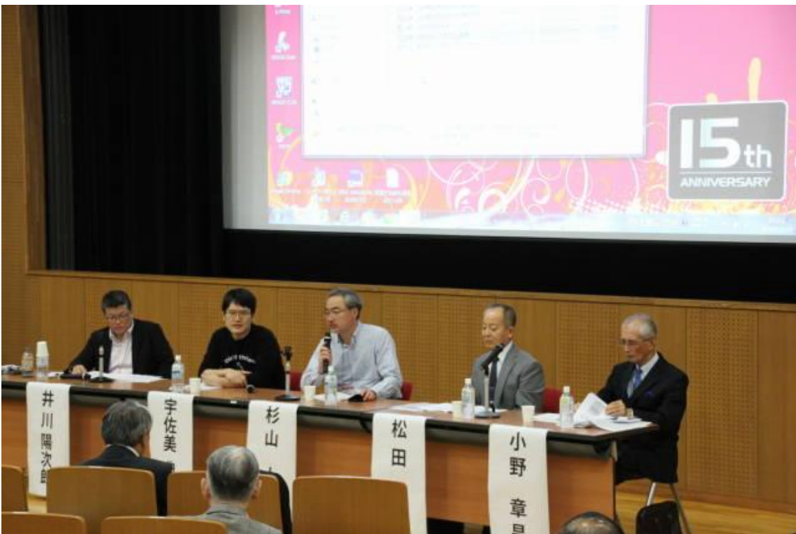
(写真その5 パネル討論全景)